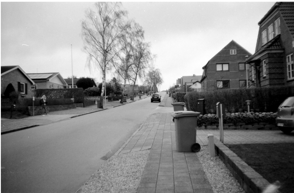
Gråvejrsgang Ilford FP4 Plus 125 ISO i kamera Balda C35 fremkaldt med hjemmelavet PaRodinal 1:50 16 minutter ved 20 grader

Efter min afprøvning er resultatet ligeså godt som med Rodinal